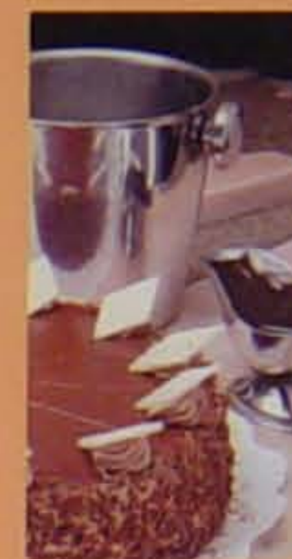
345 הוואי טורט קרם שוקולד קצפתי, ליקרים אקזוטיים ומרנג 19 HAWAII CHOCOLATE CREAM TORT, EXOTIC LIQUEURS, MERINGUE