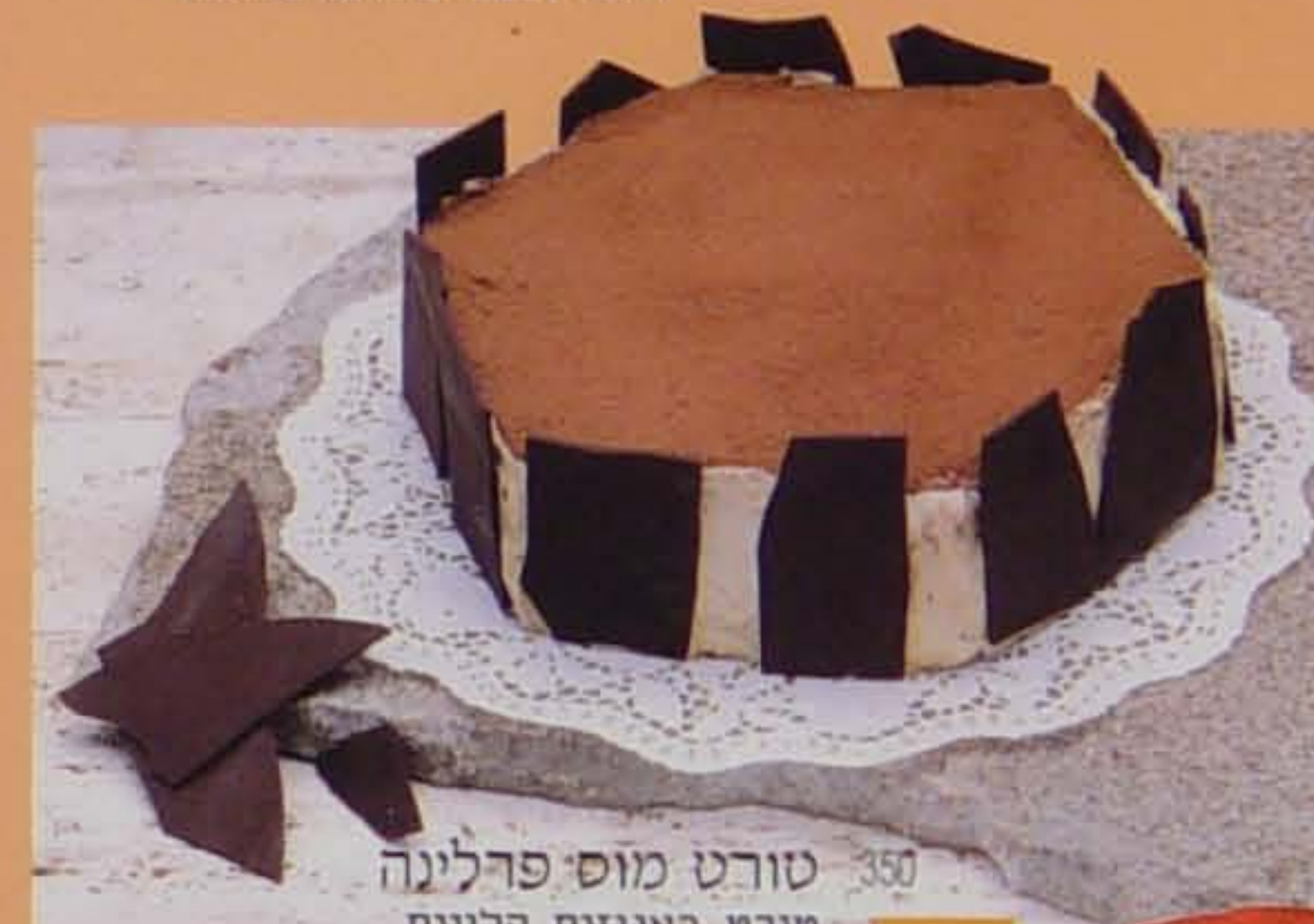
350 טורט מוס פרלינה טורט באגוזים קלויים, מוס פרלינה ושוקולד 19 PRALINEE MOUSSE BAKED NUTS AND ALMONDS TORT PRALINEE MOUSSE AND CHOCOLATE